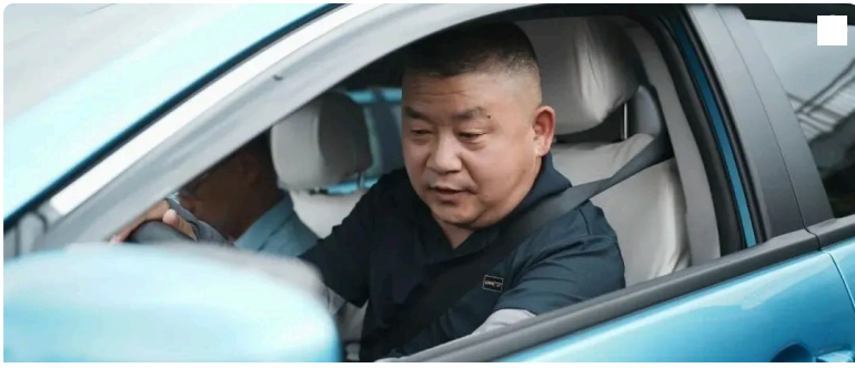
“孩子，快上车吧~”黄州的哥这一嗓子，被点赞！