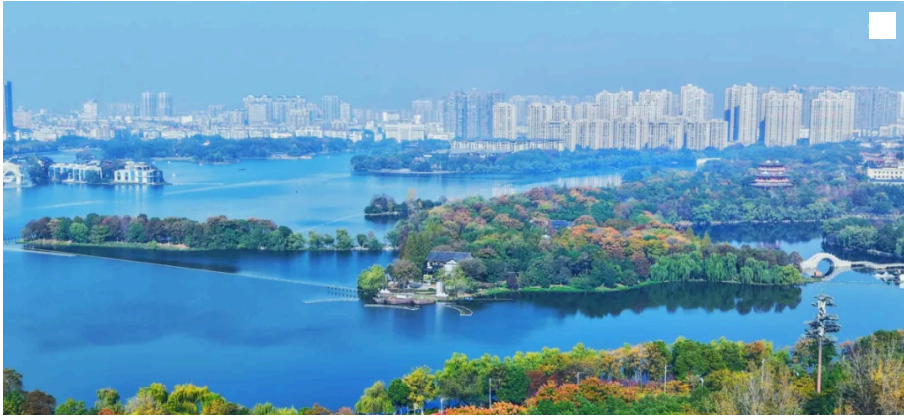
五年年均增长9%，黄州凭什么冲刺“主城崛起”？